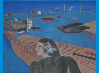
林敬二《横浜港》1988年/油彩・キャンバス/91.0×116.0cm

横浜市民ギャラリーの1,300点の所蔵作品の中より、横浜を中心に港や海、水辺を描いた作品を選びすぐりご紹介。油彩、日本画、写真、版画など約50点が出品されます。