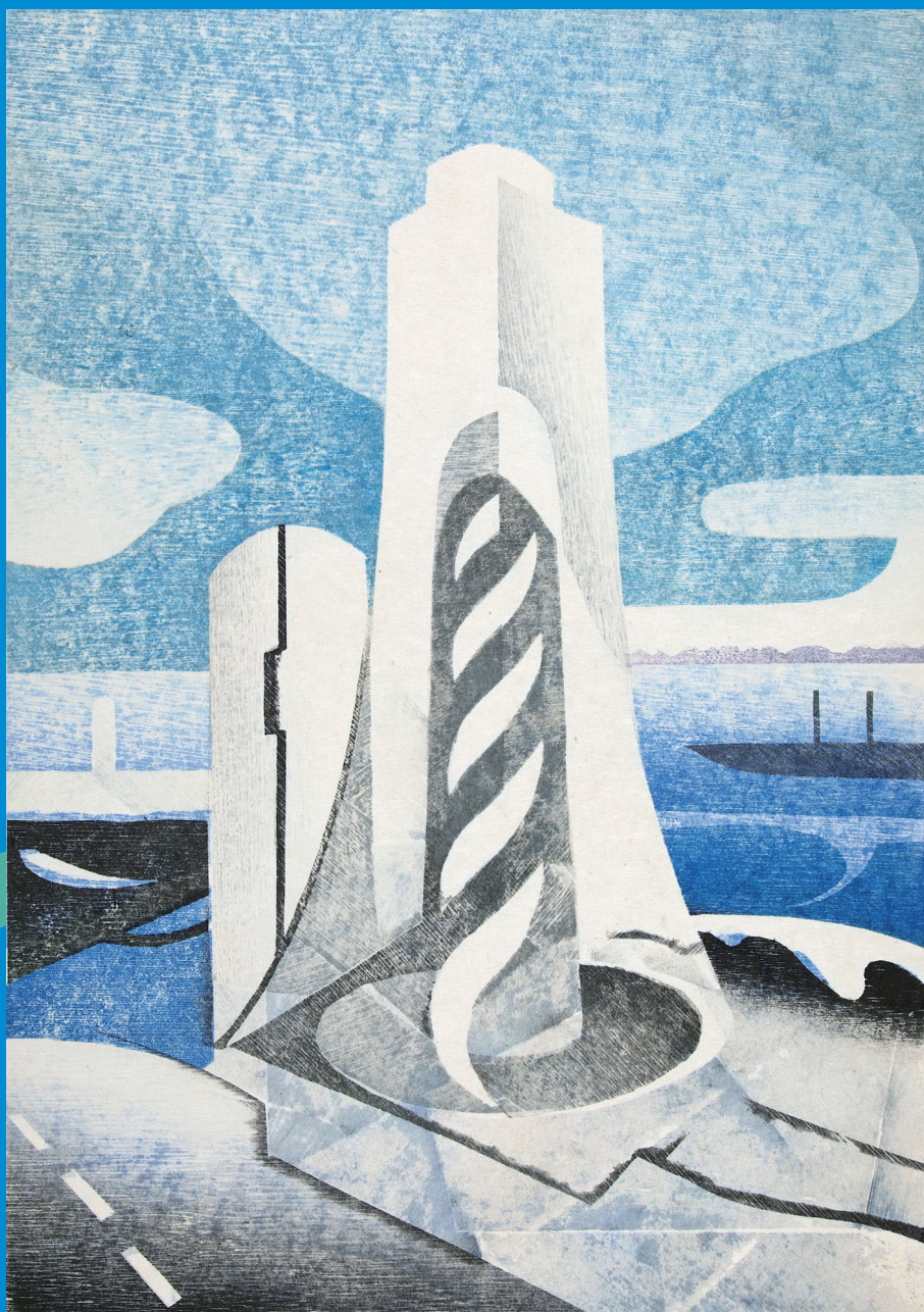
由木礼《MM21 Plaza》1988年／木版(水性多色刷り)／64.7×46.6cm

いくつか版を組み合わせ、色を摺り重ねていき、小さな和紙にあなただけの水辺の情景をあらわしてみませんか? ぼかし等、木版ならではの技法が体験できます。