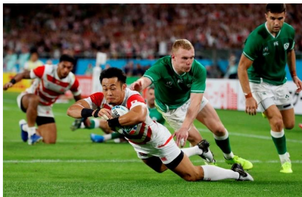
「福岡の逆転トライ」

列島興奮！本当に盛り上がりましたラグビーワールドカップ。 日本代表をいつまでも見ていたくなるような素晴らしいチームでした。心も体もドーンと来る選手たちをドーンと撮影する。カメラマンもワールドカップとの戦いです。愛をこめての真っ向勝負。カメラから火が出そうほどシャッターを押しまくりました。目下の悩みは、いまだラグビーロスが激しく、ちっとも仕事に身が入らないという現場カメラマンが報告します。約300点の報道写真展と併せて、ぜひお越しください。