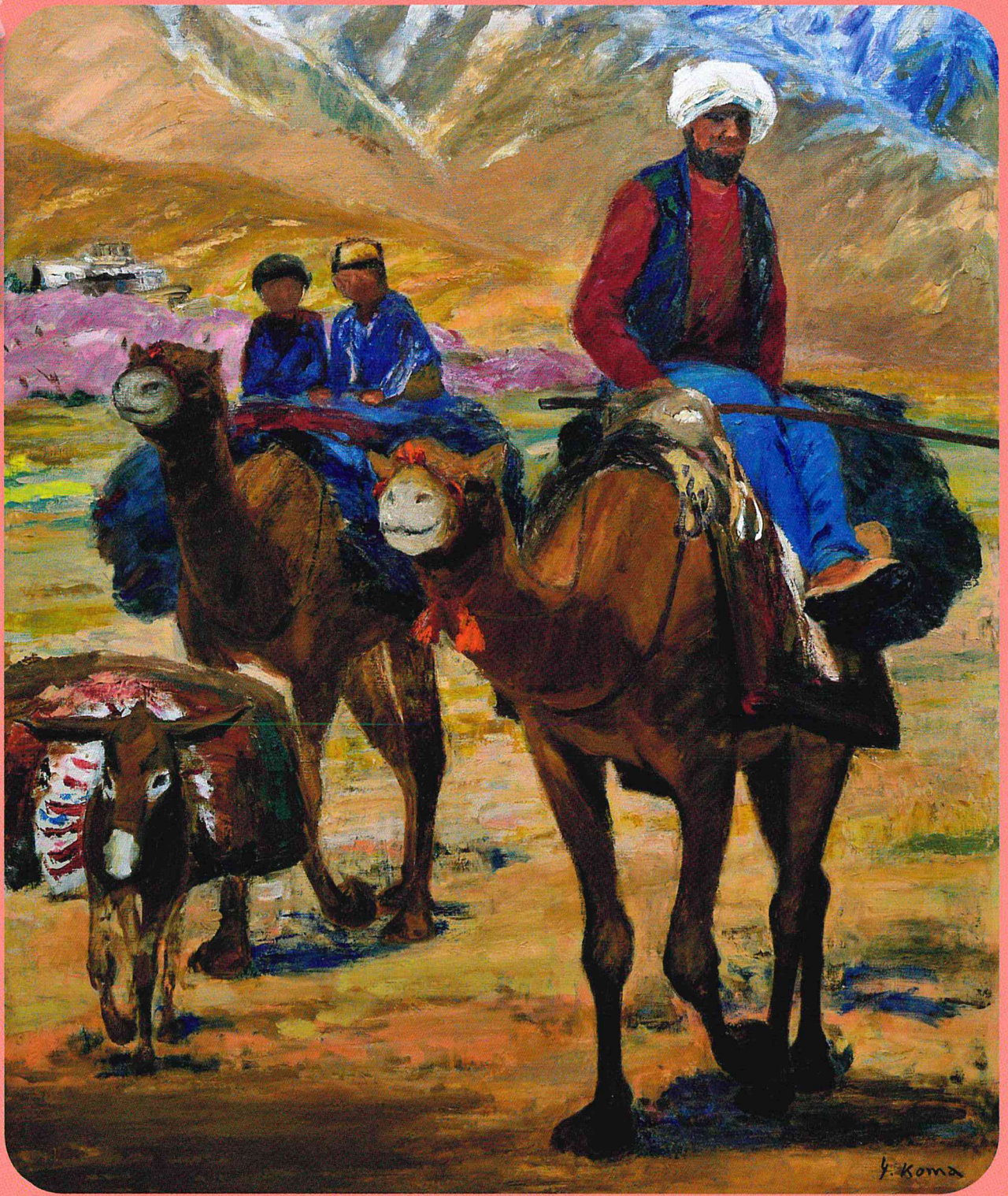
杏咲く頃 1985年 油絵、キャンバス

Koma Yoshiyuki: Landscape and People of the Silk Road