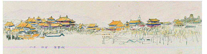
北京 故宮 紫禁城