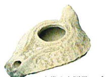
古代の土製ランプ