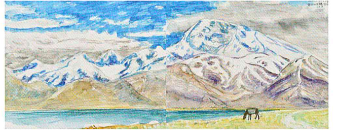
ムスタグアタ 雪山の王様(中国)