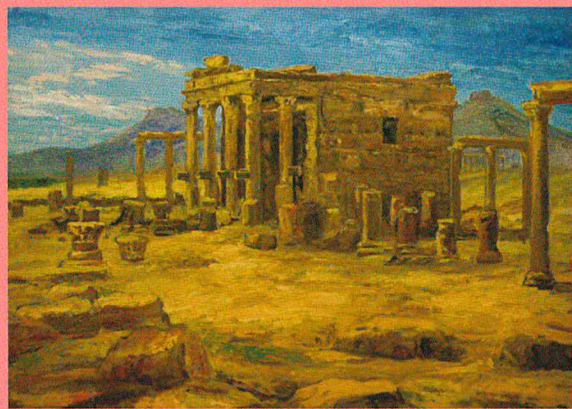
パルミラ 油絵、キャンバス

横浜ユーラシア文化館は2019年に作品の寄贈を受けました。本展では、油彩画を主体に、水彩画や題材に関わる資料を展示し、在りし日のシルクロードの風景と人々の姿をお伝えします。