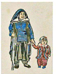
ベンジケントの道で 博物館前 (ウズベキスタン)