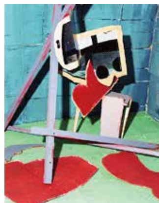
宇田川直寛 「Backward Walking Problem (後ろ歩き問題)」シリーズより 2020