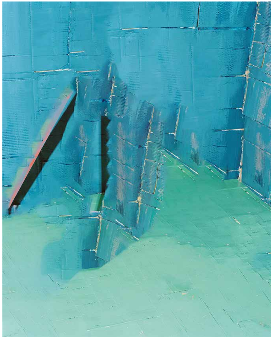
宇田川直寛 「Backward Walking Problem(後ろ歩き問題)」シリーズより 2020