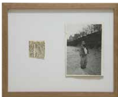
木原結花 行旅死亡人 2019