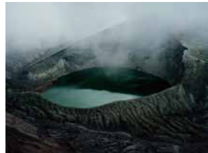
川島崇志 A Crater Lake #001 「描きかけの地誌 / 蒐集シリーズ」より 2015