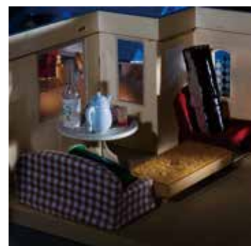
新居上実 untitled 2020