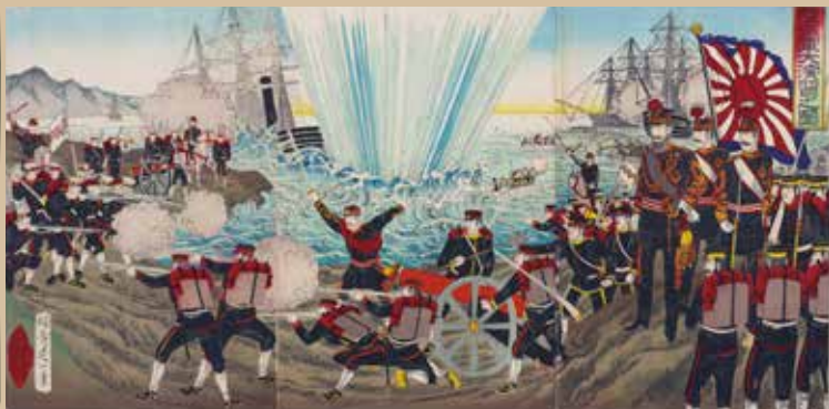
延一 陸海軍大演習之図 (前期)