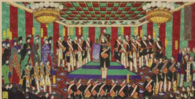
周延 憲法発布式之図 (前期)