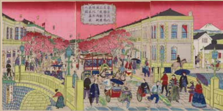
広重 (三代) 東京開化名勝京橋石造銀座通り両側煉化石商家盛栄之図 (後期)