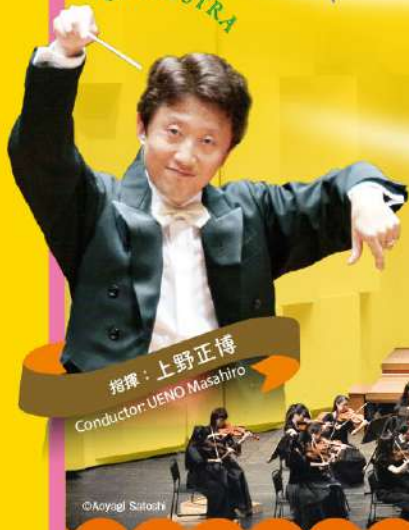
指揮: 上野正博 Conductor: UENO Masahiro