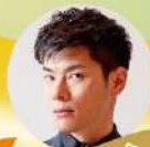
ピアノ: 外山啓介 Piano: TOYAMA Keisuke