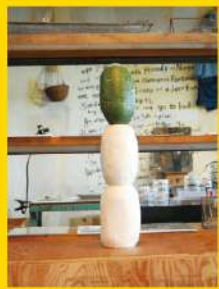
<VOID>はひとつの<MASS>になる