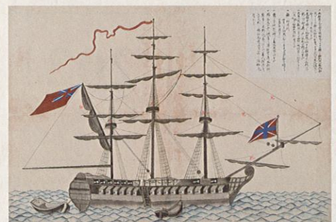
浦賀に来航した捕鯨船サラセン 文政5年(1822)