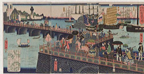
ロンドンを描いた錦絵「英吉利西龍道大港」文久2年(1862)