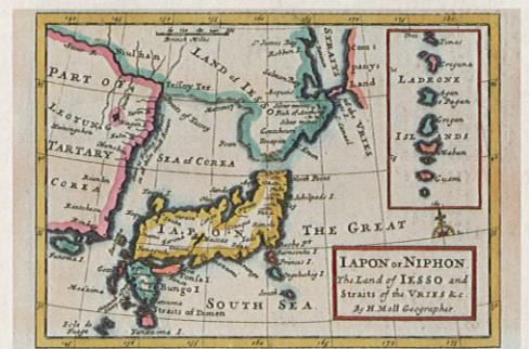
ロンドンで発行された日本地図 "Japon or Nippon" 1712年