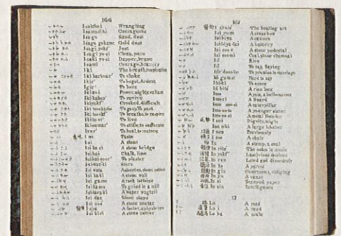
最初期の英和・和英辞書

メドハースト "An English and Japanese and Japanese and English Vocabulary" 1830年