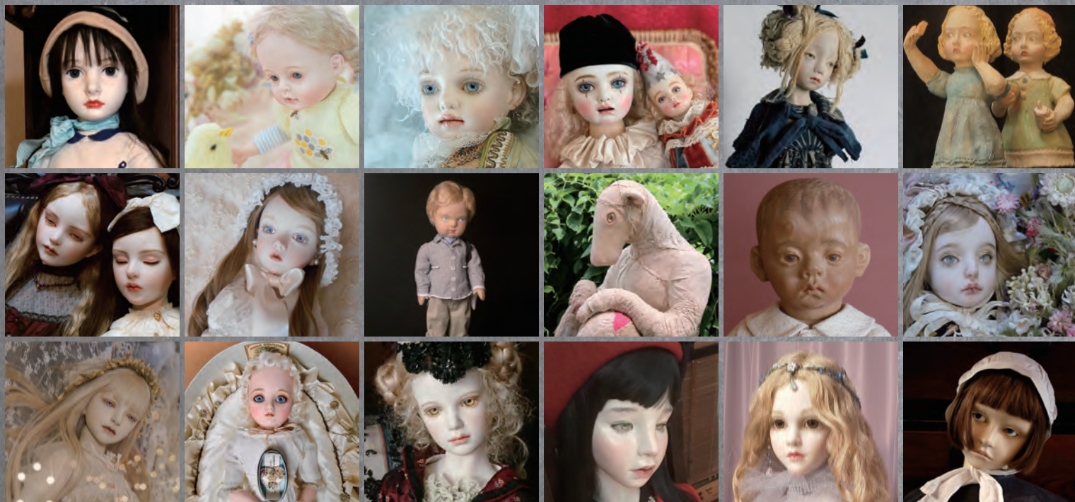
※本展会期初日となる7月10日(土)は混雑が予想されます。会期中は混雑状況によって入場制限をおこなう場合がございます。

横浜人形の家・企画展「アンティークドール×現代創作人形」は、現代創作人形作家18名が一堂に会し、当館収蔵の陶製ビスドール・布製レンチドール・自動で動くオートマタ人形などのアンティークドール作品からインスピレーションを得て、本展に向けて新たに制作した作品を中心に約90点以上を一挙にご紹介いたします。なお新作の人形作品を含む展示作品の多くは抽選販売もおこないます。作家それぞれの、伝統的な人形をリスペクトする視点を通して新たに創作された現代人形とアンティークドールとのコラボレーションをどうぞお楽しみください。