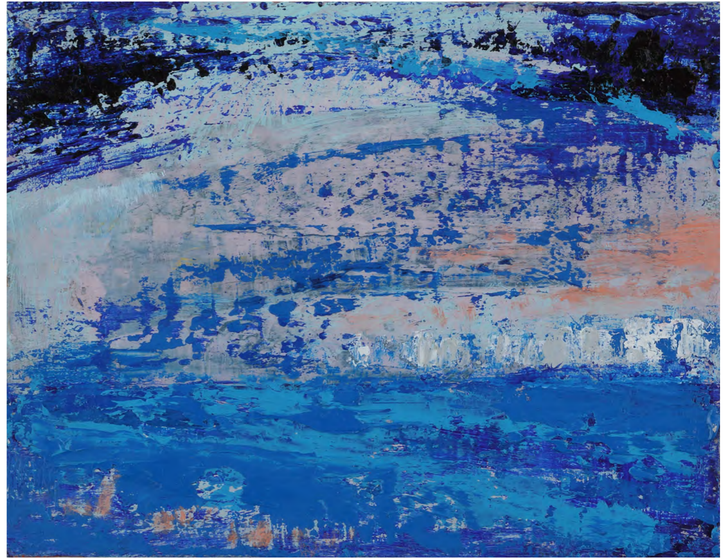
みなとみらい FO (18x14cm 油彩)