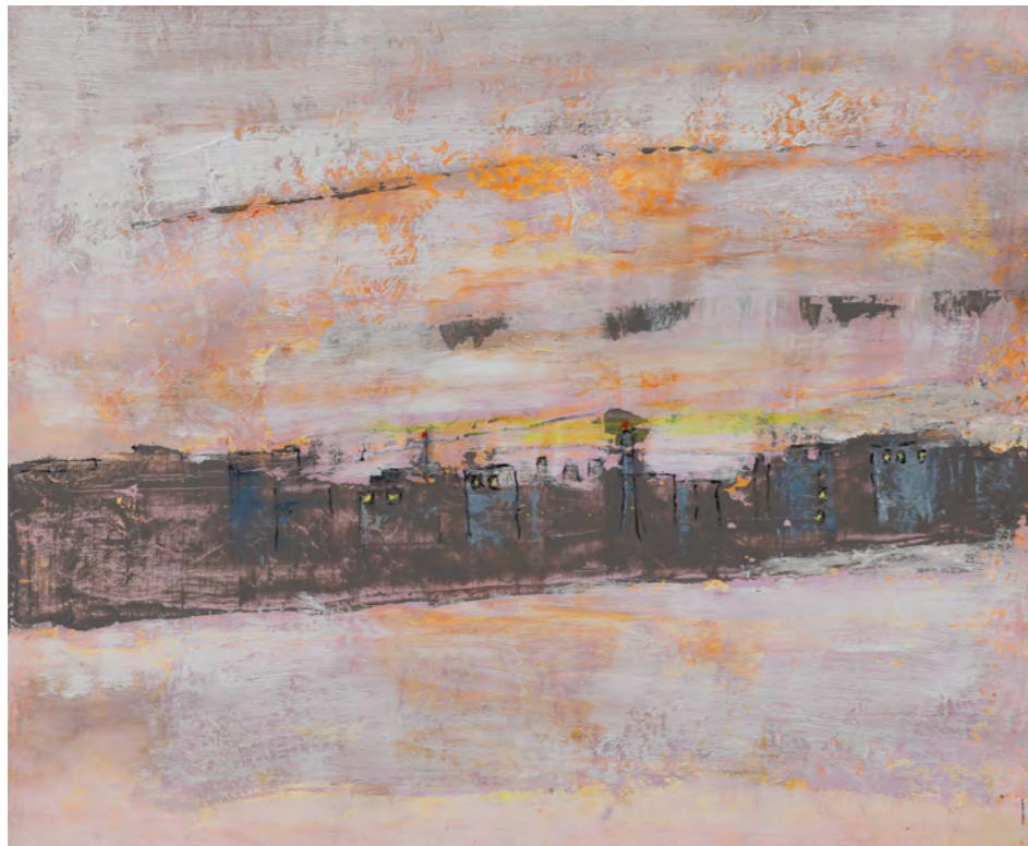
ハンマーヘッド F8 (45.5x38cm 油彩)