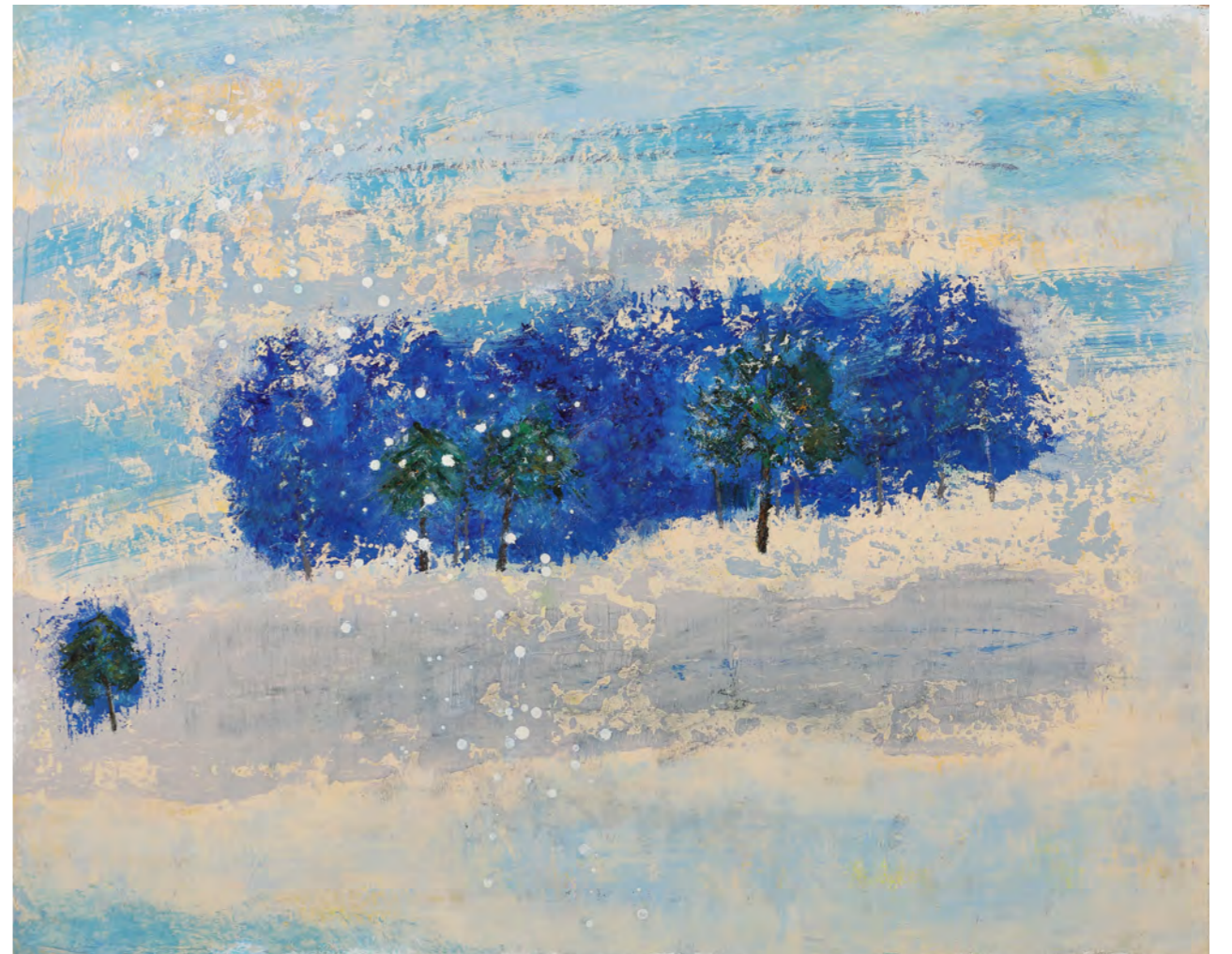
冬の箱根 F30 (91x72.7cm 油彩)