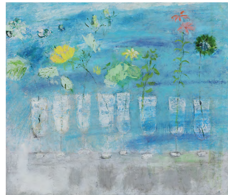
山手 Flower展 F10 (53x45.5cm 油彩)