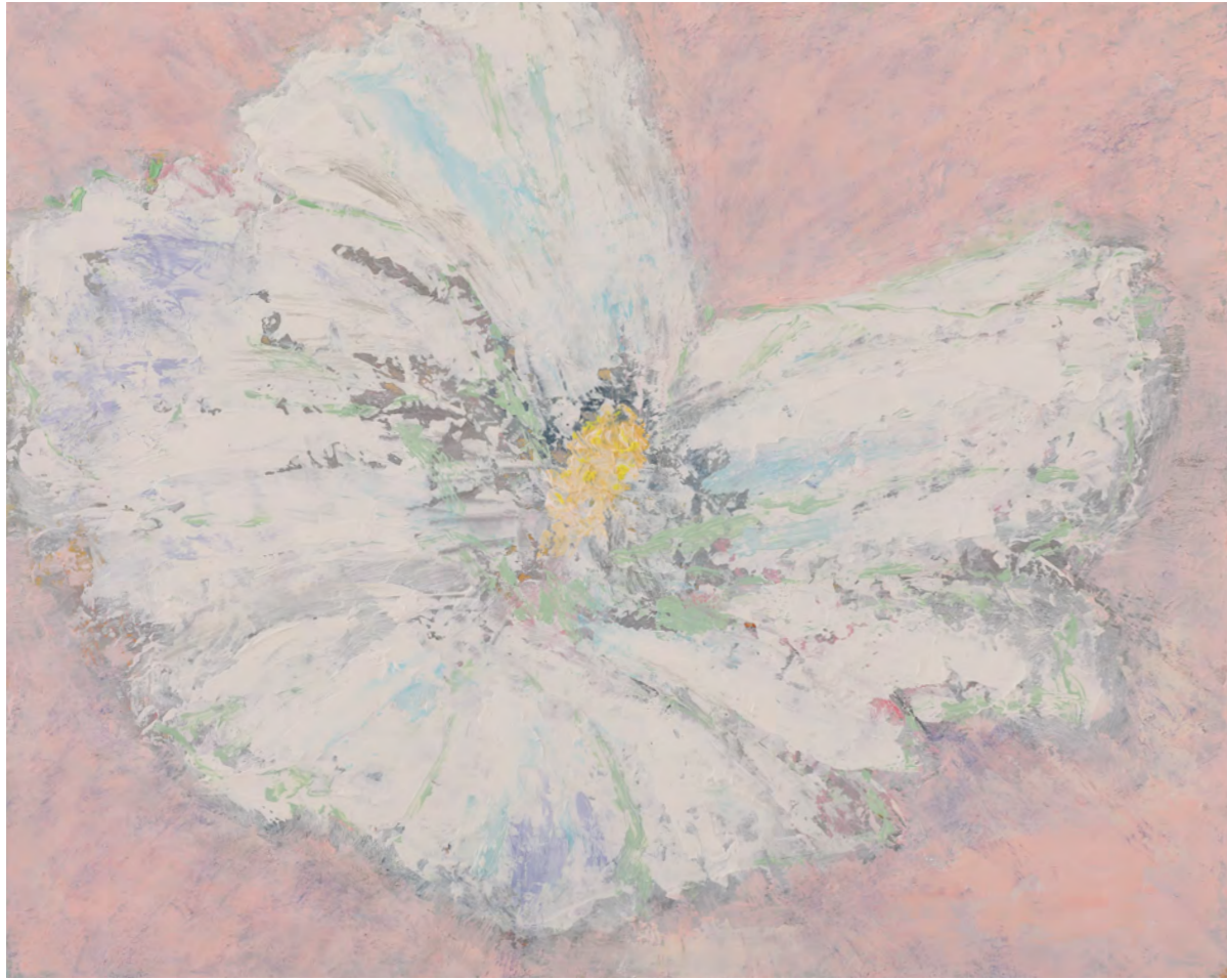
木槿 F3 (27.3x22cm 油彩)