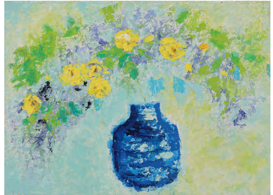
バラ F4 (33.3x24.2cm 油彩)