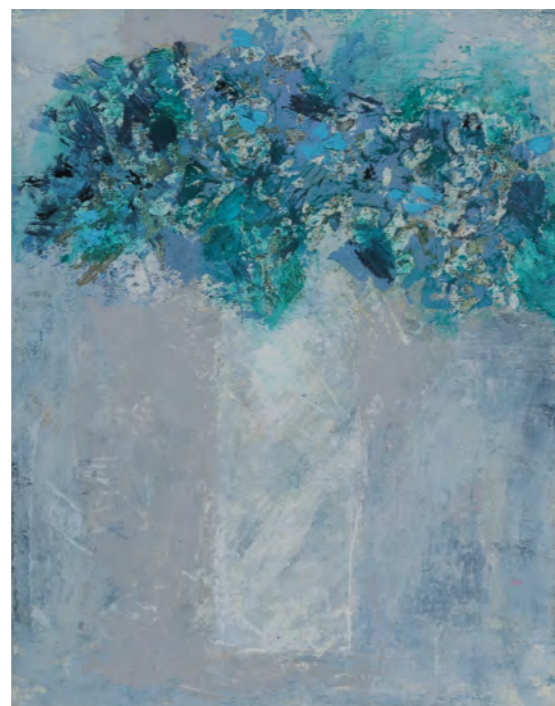
紫陽花 F0 (18x14cm 油彩)