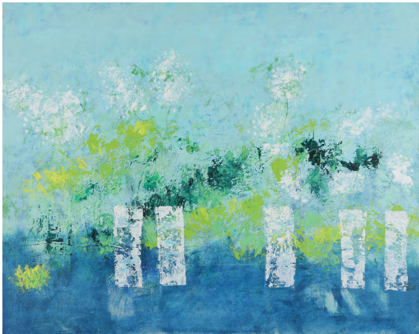
スモークツリー F30 (91x72.7cm 油彩)