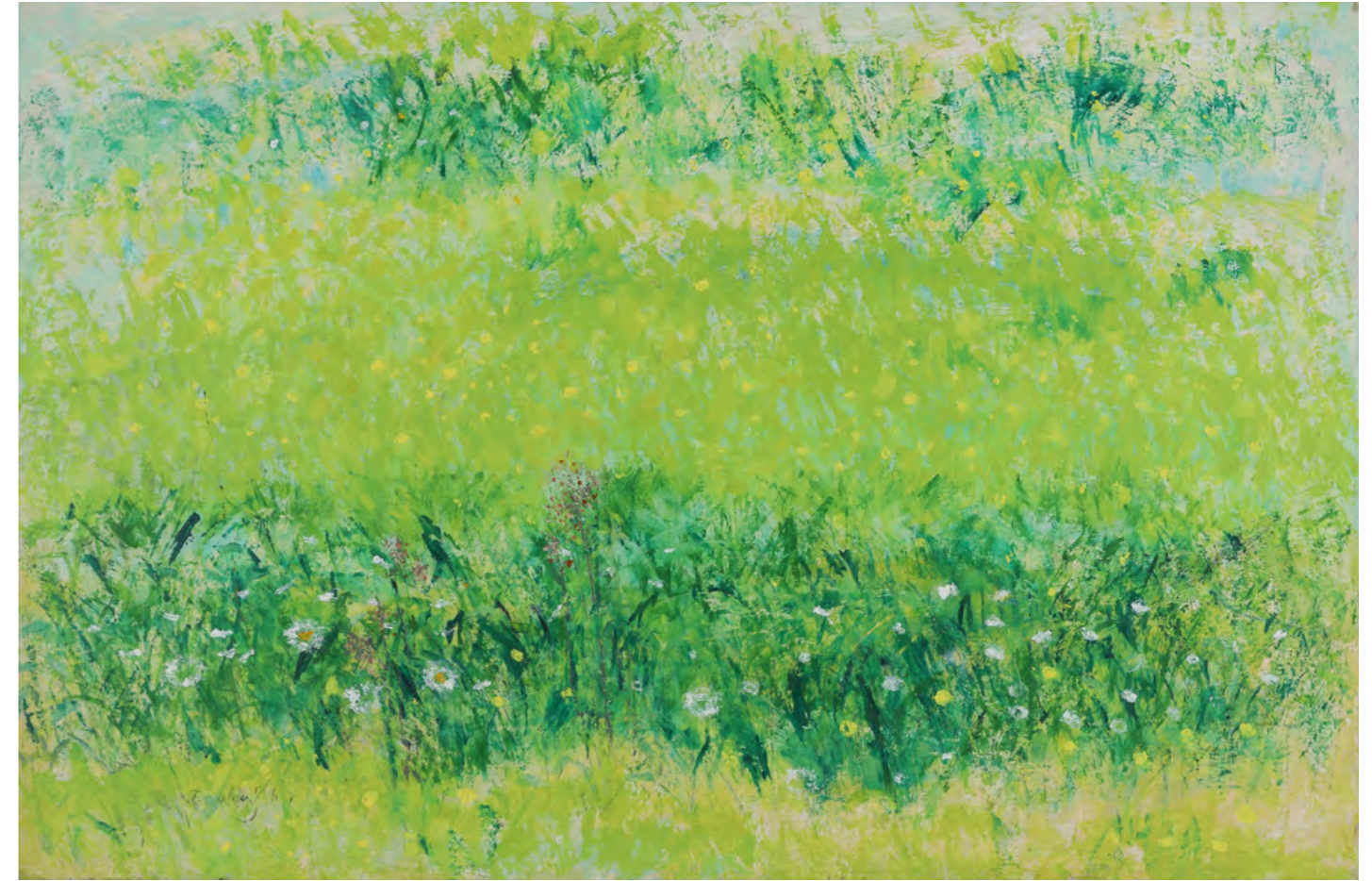
見沼田圃 M25 (80.3x53cm 油彩)