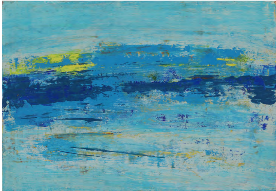
朝の海 SM (22.7x15.8cm 油彩)