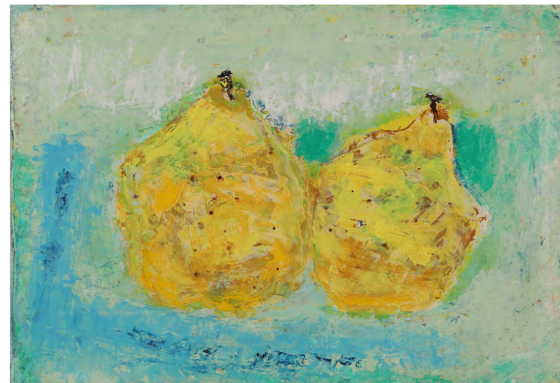
ラフランス SM (22.7x15.8cm 油彩)