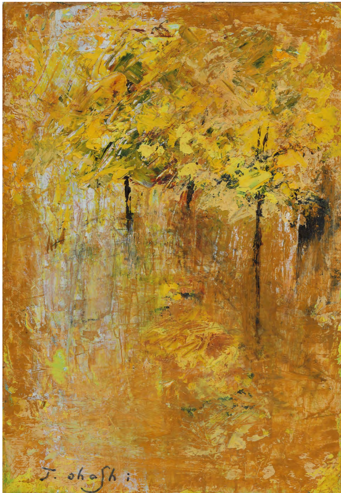
遊歩道の銀杏 SM (22.7x15.8cm 油彩)