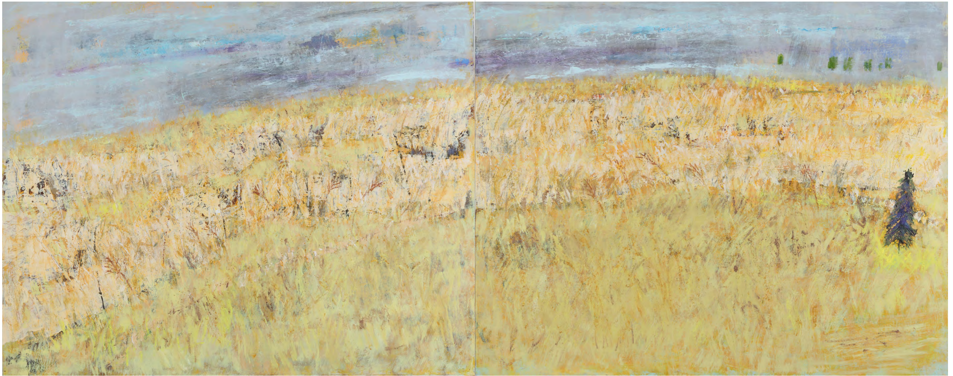
仙石原高原 F30x2 (182x72.7cm 油彩)