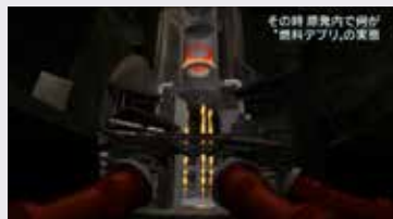
CGを用いて伝えた原発事故

『報道ステーション』のスタジオセットと原発内部の大型模型は、本年度、伊藤薫朔賞の本賞を受賞!この賞は、毎年、最も優れたテレビ美術が成された番組に与えられるものです。