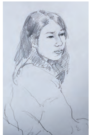
講師参考作品(クロッキー)