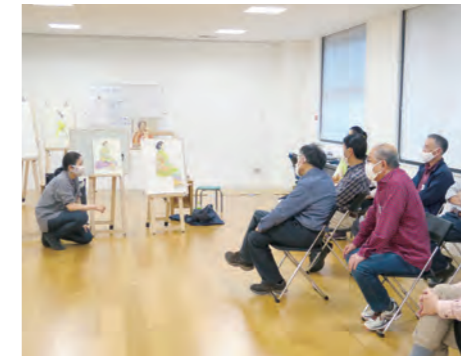
講座イメージ(講習会の様子)