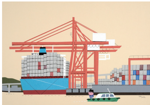
本牧埠頭コンテナバース 1993(平成5)年 切絵