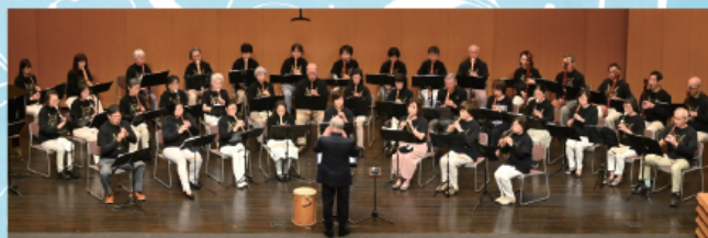
杉劇リコーダーズ