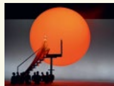
《アクナーテン》

プレイベント | METライブビューイング フィリップ・グラス 《アクナーテン》《サティアグラハ》上映会