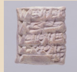
楔形文字粘土板文書 南イラク ウル第3王朝期 紀元前2000年頃