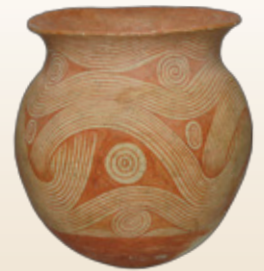
彩文壺 タイ東北部 紀元前1千年紀