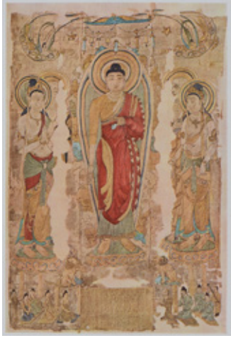
The Thousand Buddhas 1921年刊