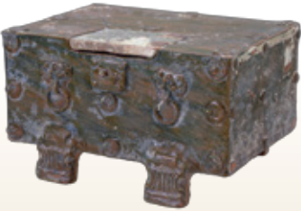
緑釉櫃 中国 後漢時代 1~3世紀