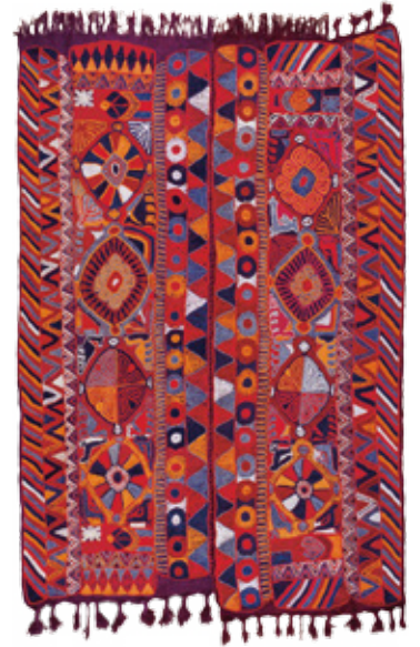
動植物文敷物 イラク 20世紀