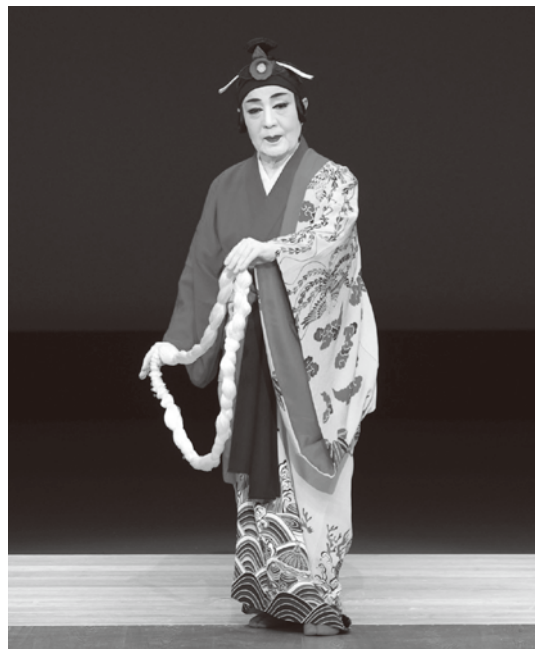
「蜻蛉羽」志田房子