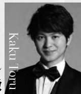
バリトン 加来 徹