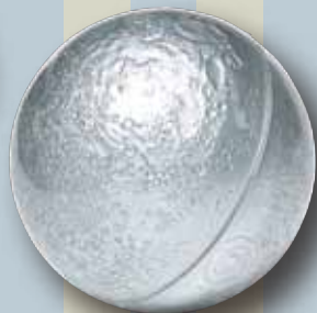
裏側もわかる立体月球儀 「6年の科学」1969年3月 Gakken蔵