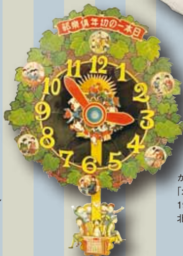
かざり時計 「幼年倶楽部」 1935年1月 北原照久氏蔵