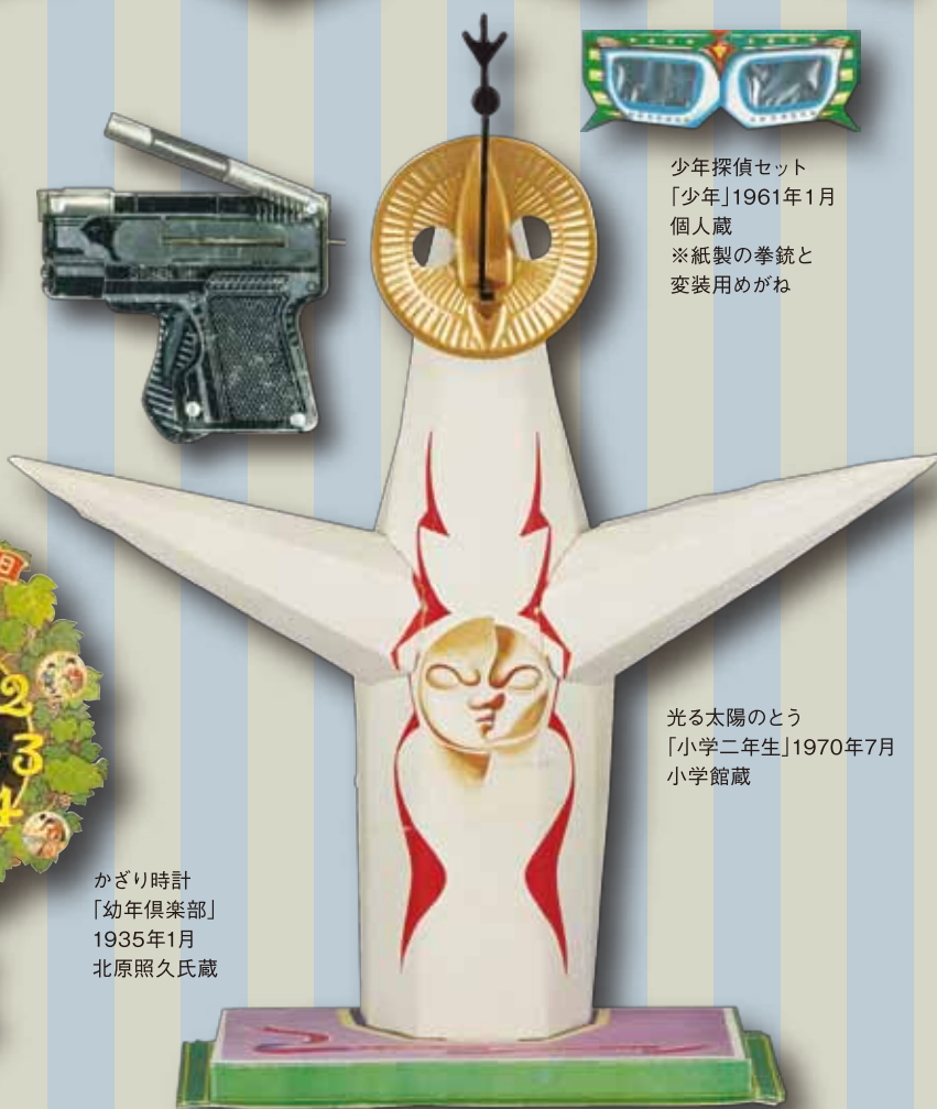
光る太陽のとう 「小学二年生」1970年7月 小学館蔵