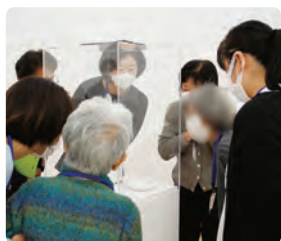
2022年度の鑑賞会の様子

「やさしい美術鑑賞会(高齢者・認知症の方とその介護者を対象とした美術鑑賞会)」は2024年1～3月頃の実施を予定しております。詳細についてはウェブサイト等で情報を公開する予定です。