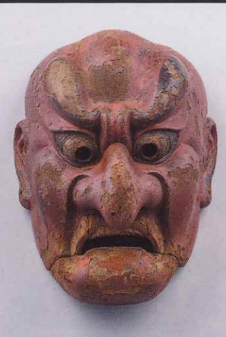
抜頭面 運慶作 瀬戸神社 重要文化財 建保七年(1219)運慶が夢想により製作