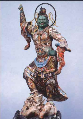
四天王立像(持国天) 海住山寺(京都) 重要文化財 解脫上人貞叡ゆかりの四天王像で運慶工房作とみられる