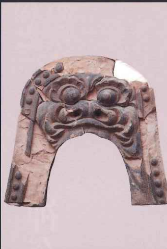
鬼瓦 鎌倉市教育委員会 鎌倉永福寺出土で原型は運慶工房作とみられる