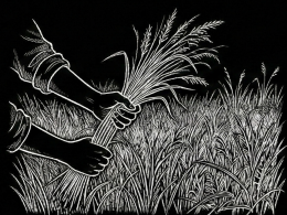
横浜市内で草を採取し