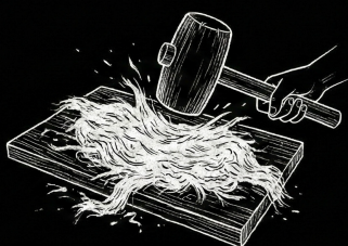
この素材をハンマーで叩き