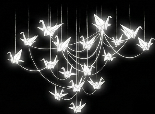
残りの紙は形を変え展覧会で 作品として展示されます。

草から手作りで紙を作る 4 時間のワークショップです。ワークショップ参加者は、漉いた紙のうち、1 枚をお持ち帰りいただけます。残りの紙は光る鶴の形になり、1 月 24 日から 2 月 1 日に横浜市鶴見区民文化センターサルビアホールのギャラリーで開催される田口佳月の展覧会にて、大きなインスタレーション作品の一部として展示されます。皆様は「体験者」であると同時に、このアートプロジェクトの「共同制作者」となります。