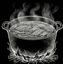
長時間煮込んだ素材を 会場に持っていきます。