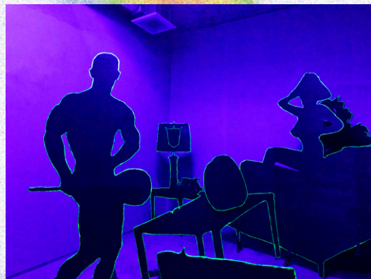
タムロ・ダブル 《# 一体何が今日の家庭をこれほどに変え、魅力あるものになっているのか》