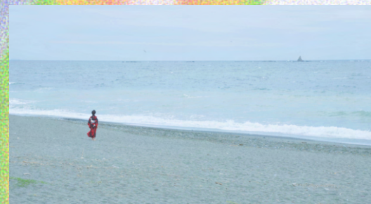
福士りさ 《二人の女》