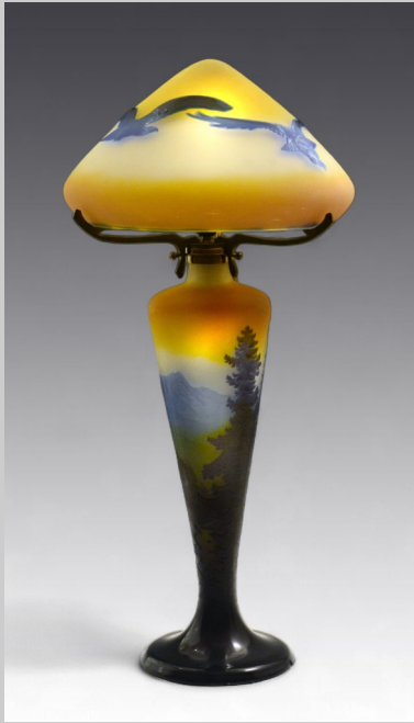
ガレ 鷹に山脈文ランプ 1918-1931年