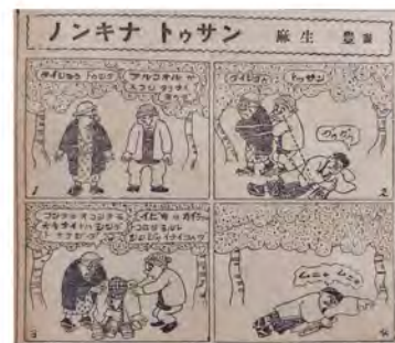
夕刊報知新聞 「ノンキナトウサン」 麻生豊 1924(大正13)年4月15日

北沢楽天の邸宅跡地に建つさいたま市立漫画会館では、北沢楽天生誕150周年を記念した展覧会などを開催予定!