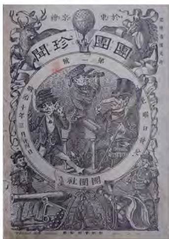
團圓珍聞(まるまるちんぶん) 第1号 1877(明治10)年3月24日