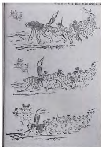
時事新報 名古屋繁昌の景 新聞きしや 今泉一瓢 1890(明治23)年4月1日

2026年7月20日は、明治から昭和初期に活躍した漫画家・北沢楽天の生誕150年にあたります。福沢諭吉が1882(明治15)年に創刊した時事新報の漫画記者になった楽天は、同紙が1902年に設けた「時事漫画」のページを舞台に、世相を風刺とユーモアに富んだ漫画で描くとともに、「灰殻木戸郎」「丁野抜作」などのさまざまな個性豊かなキャラクターを生み出しました。「時事漫画」は好評を博し、1921(大正10)年には別刷りでカラーの日曜付録になりました。