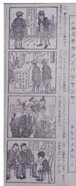
東京朝日新聞 「正チャンノバウケン」 作:織田小星、画:樺島勝一 1923(大正12)年10月20日